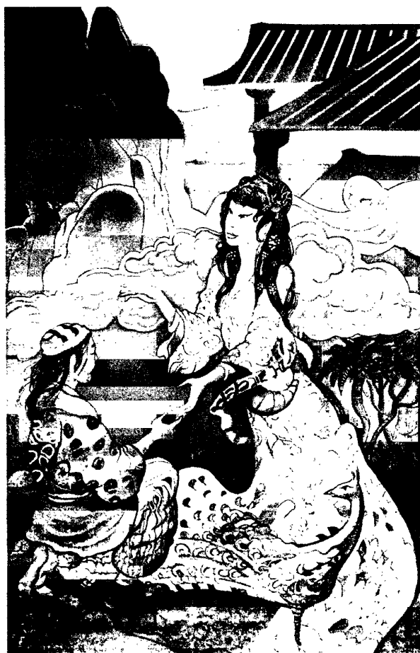
Ilustración de Marcelo Spotti para La señorita pavo real . Cuentos de la China milenaria. Editorial Anaya.

"Siempre que se ve o lee un clásico se tiene ante sí al portavoz de un modo de pensar"