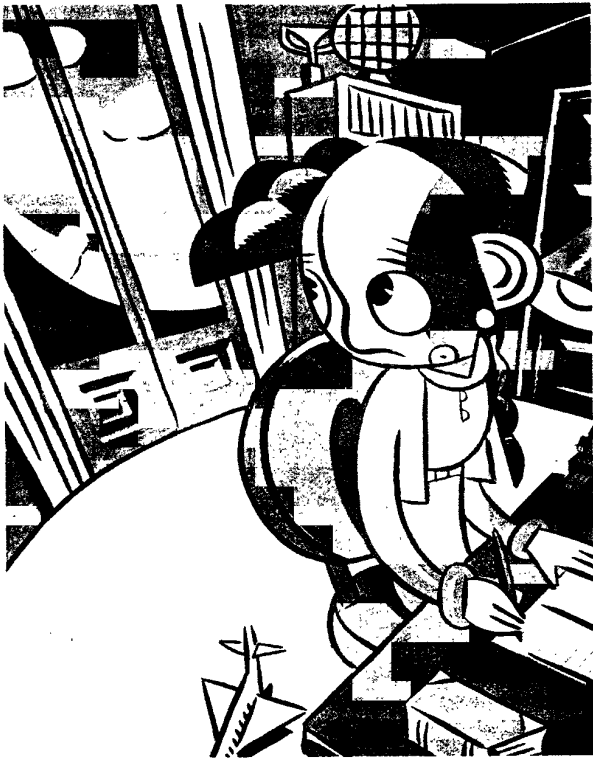
Ilustración de Francesc Infante para El cel té un problema . Editorial Publicacions de l'Abadia de Montserrat.

Se aproximará por lo tanto al concepto historicista de clásico un uso respetuoso de los códigos de la tradición simbólica, que también pueden hallarse, por ejemplo, en el uso del color (el rojo, el azul, etc): La boîte de la Caperucita francesa , Los payasos de Pakovska , La nocturnidad de Lemoine , el París francés .