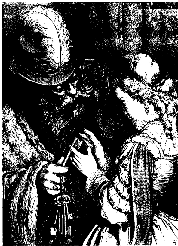
Ilustración de Gustave Doré para Barba Azul. Cuentos de Antaño. Editorial Anaya.

prensa ilustrada, en pleno apogeo en las décadas que enlazan los siglos XIX y XX, a los que no les importó trabajar también para una incipiente literatura infantil. Trabajaron de un modo tan intuitivo como brillante, en escenas sueltas, que no en secuencias. Exactamente igual a como se trabajaba en la prensa ya fuese de sucesos o satírica. Sus ilustraciones son como cromos, como cuadros, sin ninguna hilación narrativa, colocadas acá y acullá dentro de un texto. Por esto creo que no son, no pudieron ser, strictu sensu, ilustradores, sino magníficos dibujantes, grabadores, o viñetistas. Ellos son los precedentes históricos de algo que no alcanzará su madurez hasta hoy. Los clásicos de la ilustración se están produciendo hoy. Pues no es hasta hoy que existen las condiciones óptimas para el desarrollo y difusión de este arte. A saber: unos editores especializados,